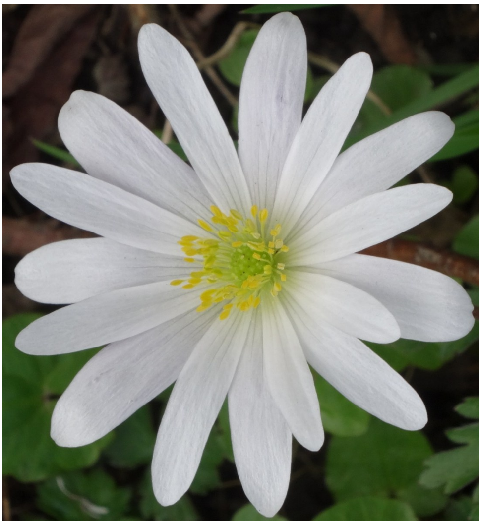
Blume in unserem Garten – wie wunderschön ist die Natur ...

(Titelseite: bei Zistersdorf, Niederösterreich)