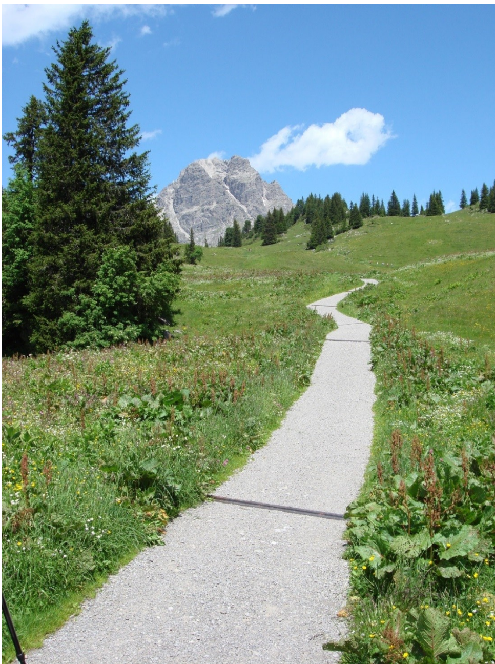
Wanderweg beim Körbersee (Vorarlberg), mit Widderstein