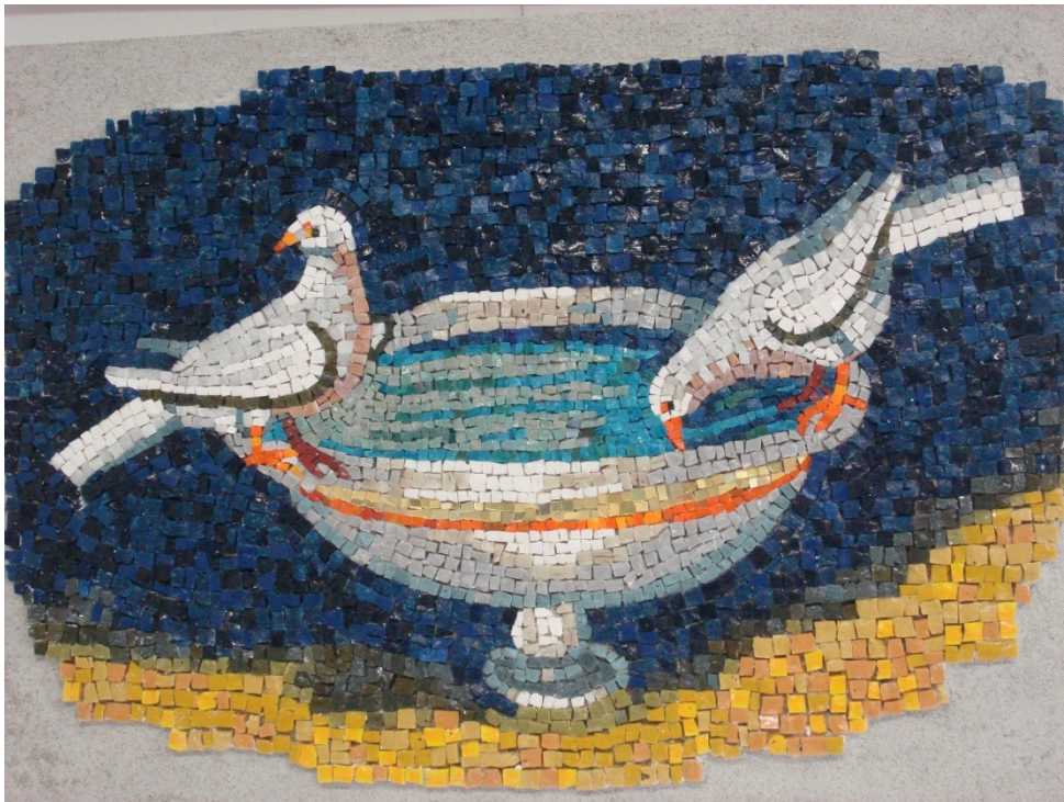
Mosaik in einer Keramikwerkstatt, Ravenna/Italien