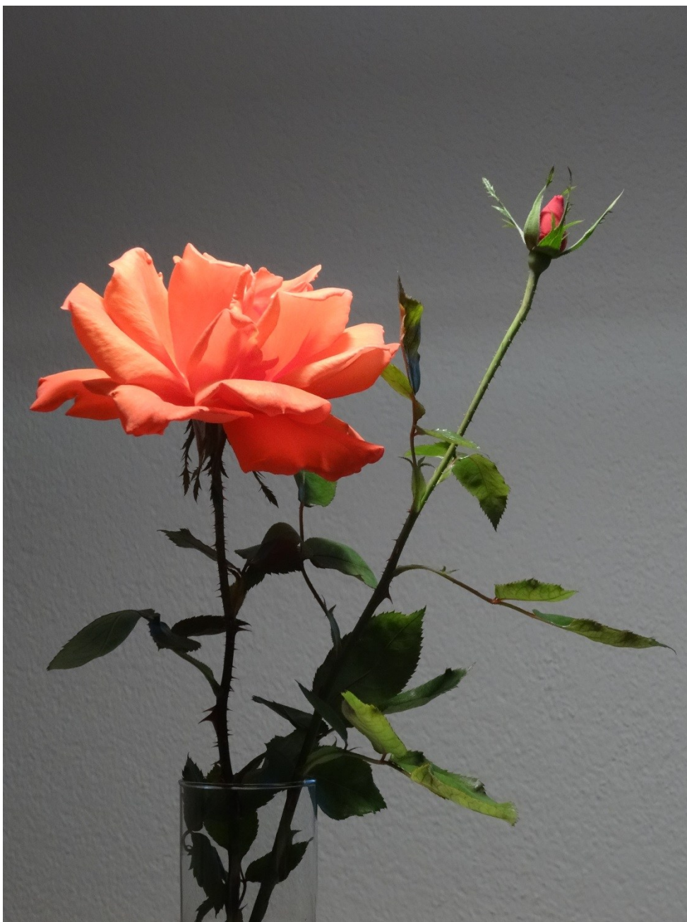
schön trotz Dornen, aus heimischem Garten