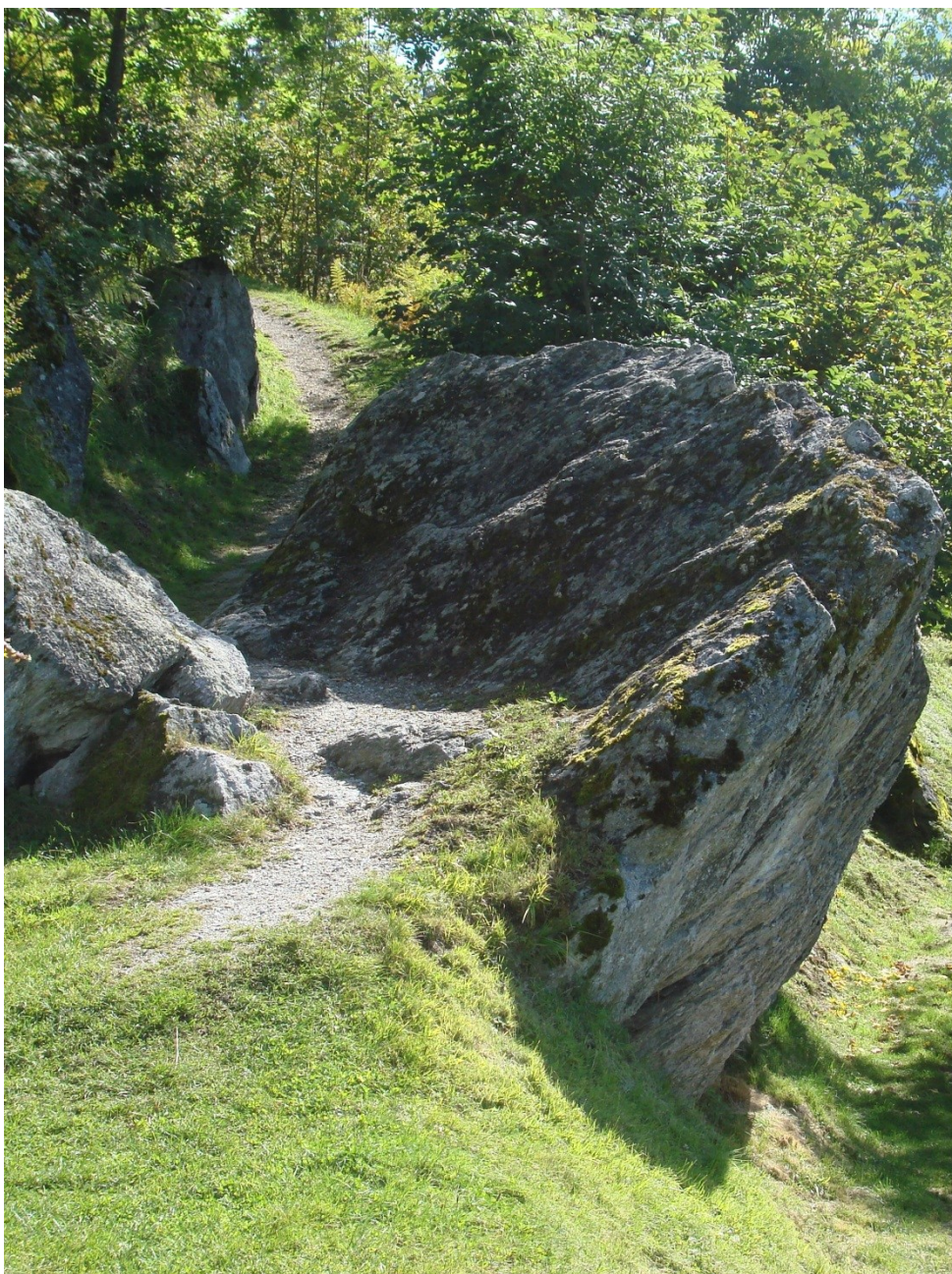
Wanderweg bei Falera, Graubünden/Schweiz