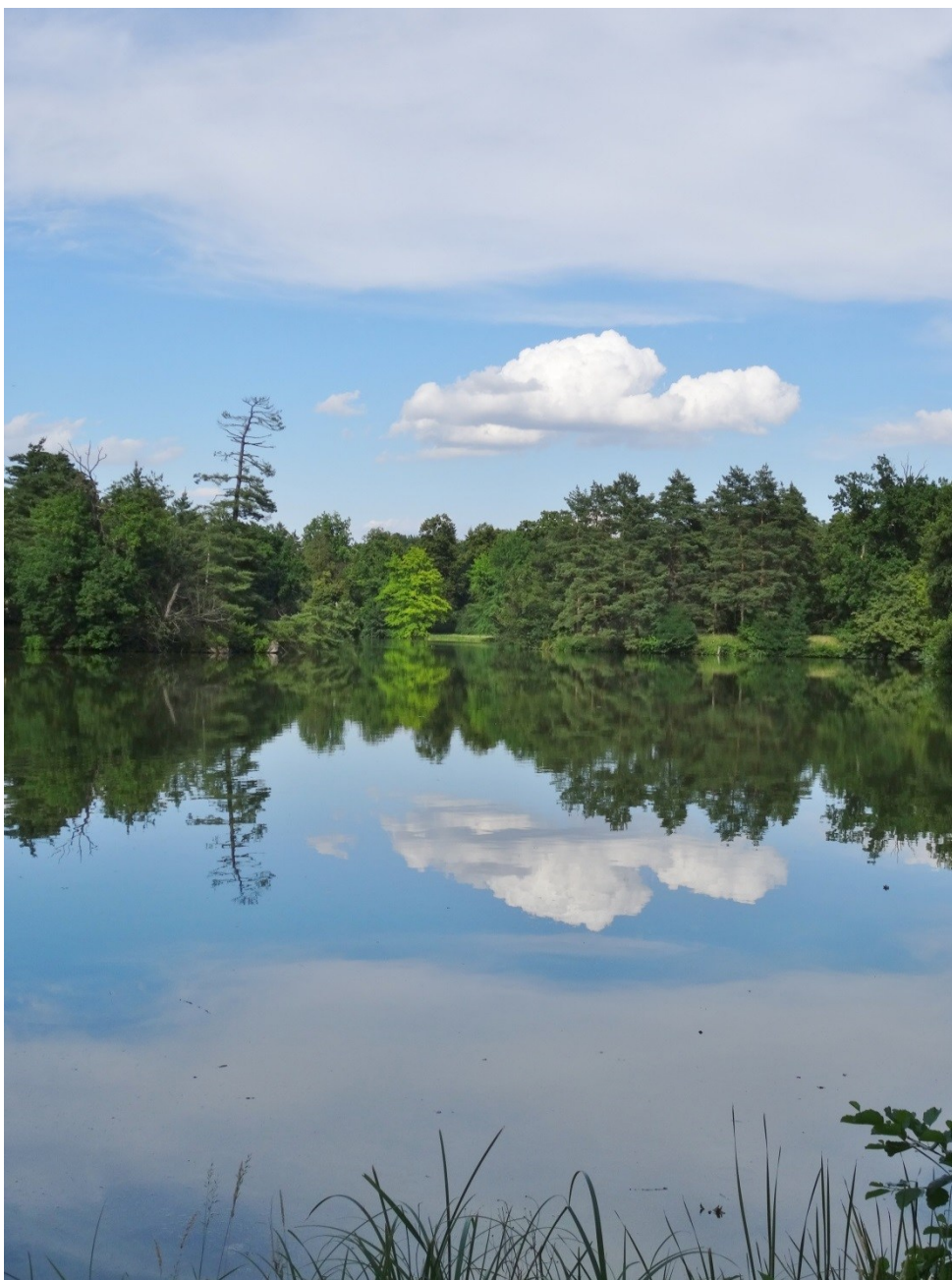
im Schlosspark Lednice, Mähren