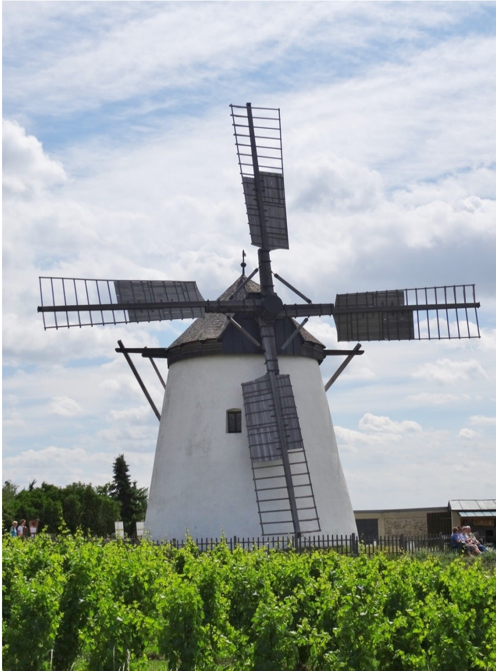
Windmühle in Retz, Niederösterreich