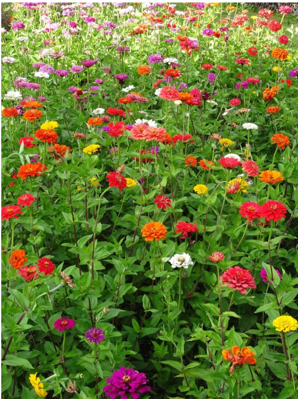
Blumen beim Kloster Mehrerau, Bregenz, Vorarlberg