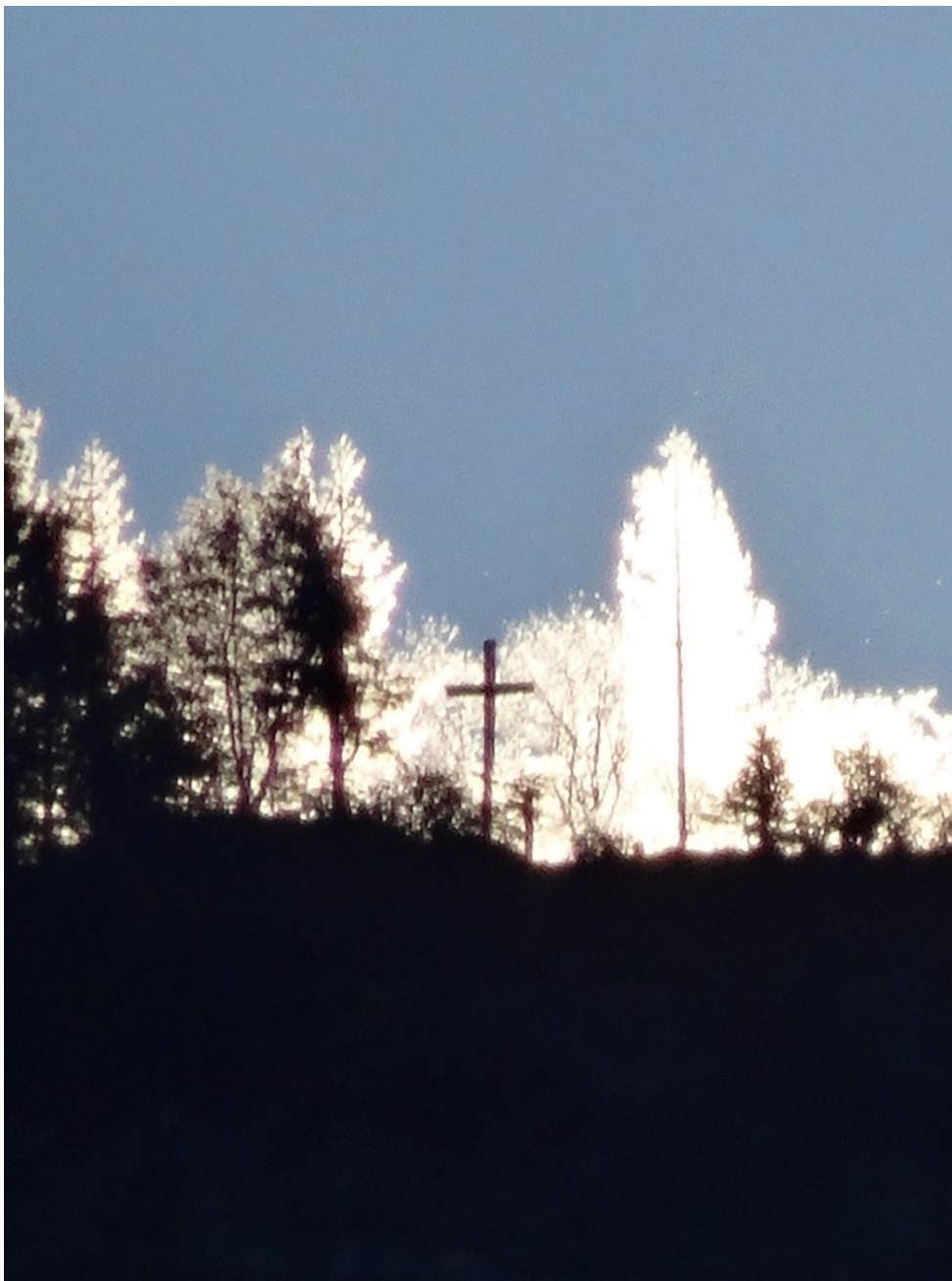
Sonnenaufgang beim Kreuz auf dem Kapf, Vorarlberg