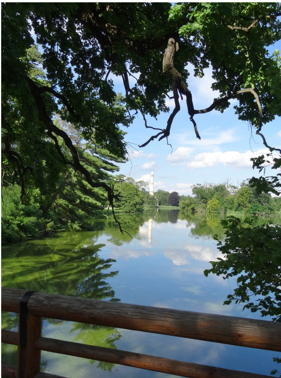
im Schlosspark Lednice, Mähren