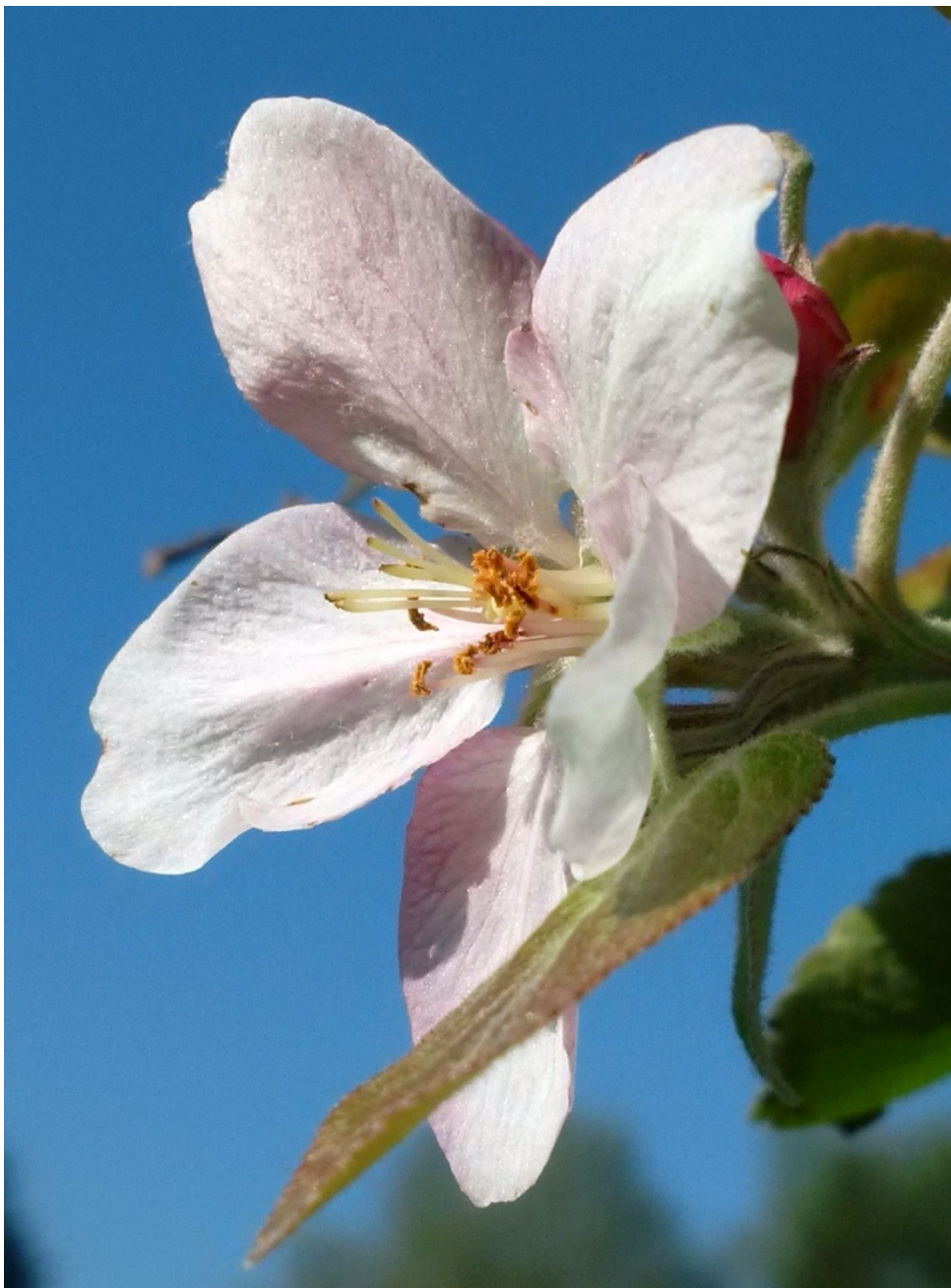
Apfelblüte im Oktober