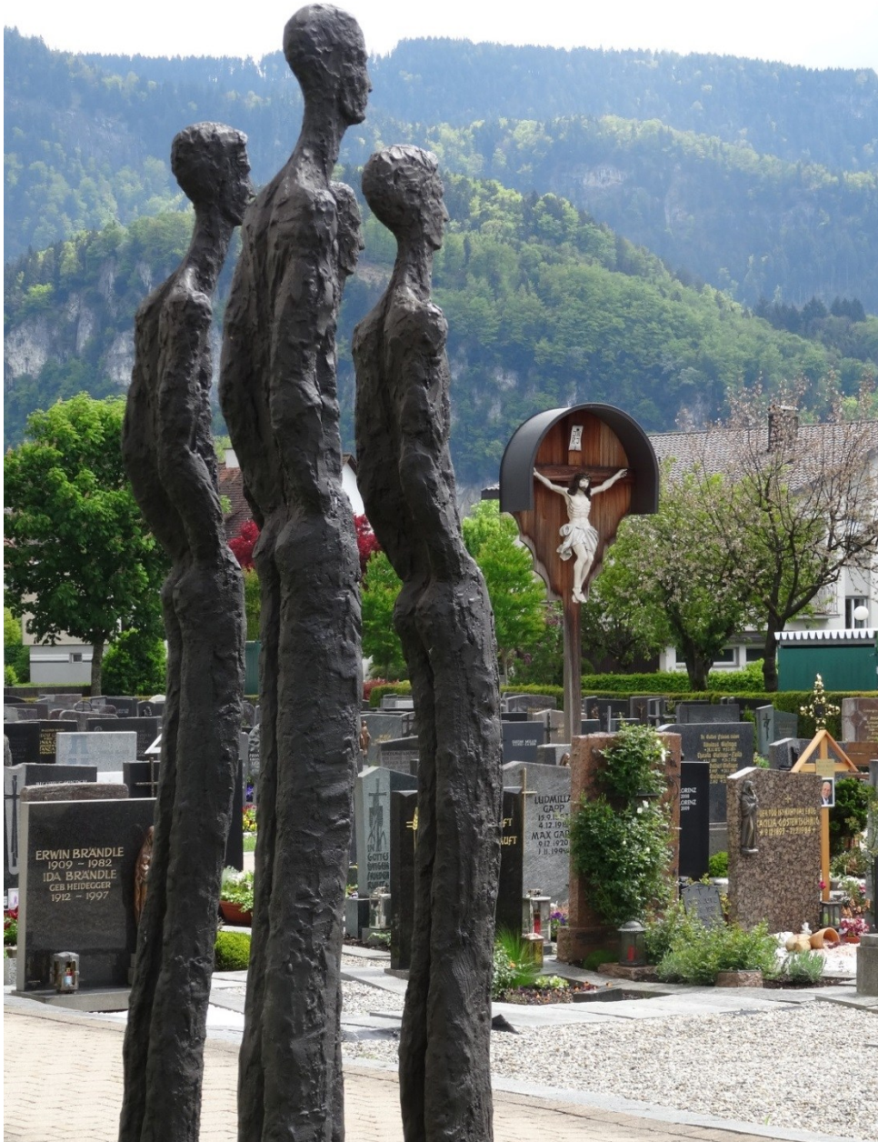
Friedhof in Altach

Hiob ist ein frommer Mann; dennoch nahm ihm das Schicksal alles, was er hatte: Besitz, Familie, Gesundheit. In Anlehnung daran bezeichnet der umgangssprachliche Begriff „Hiobsbotschaft“ eine schlimme Unglücksnachricht.