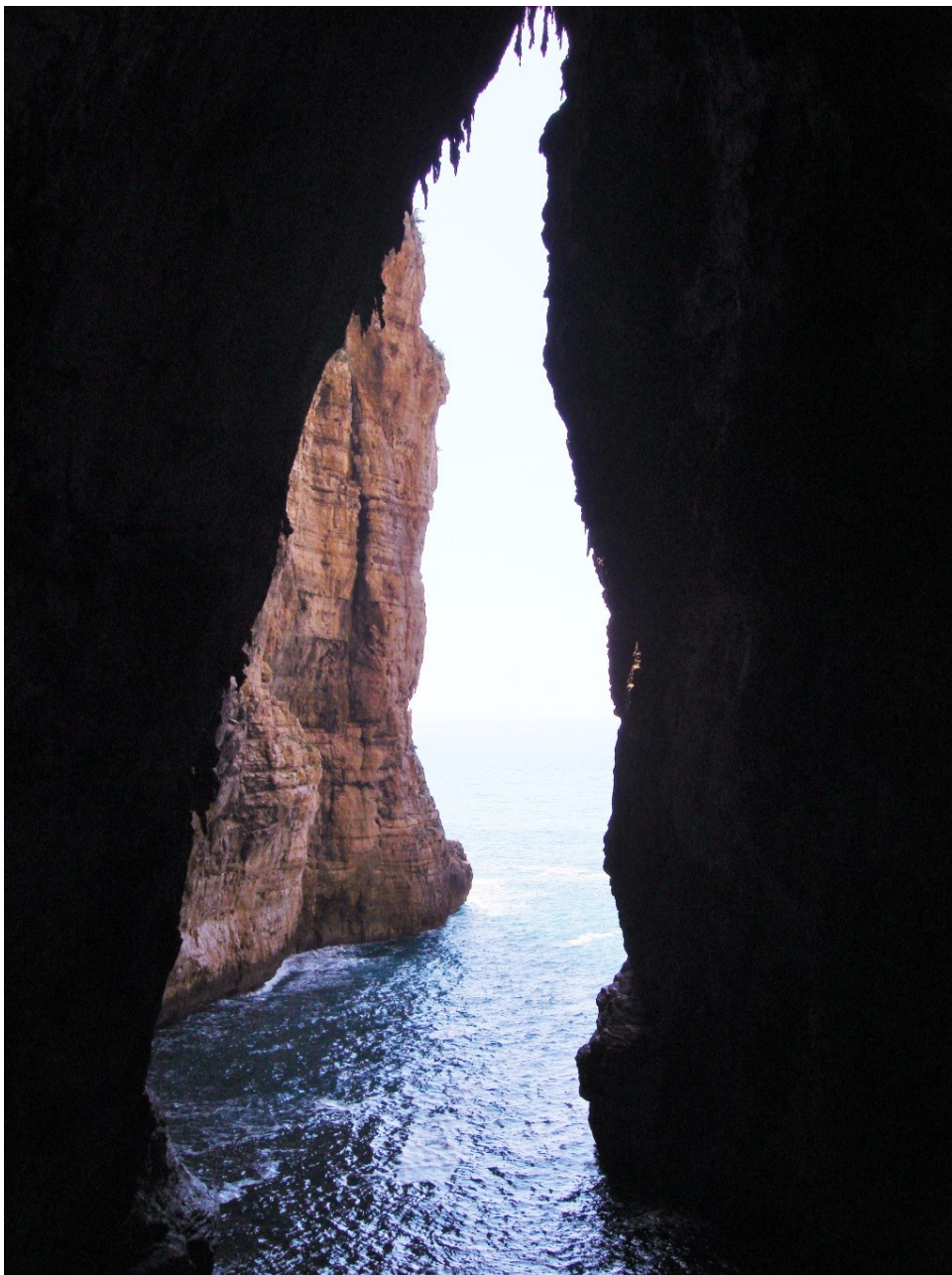
gespaltener Berg bei Gaeta, Latium/Italien