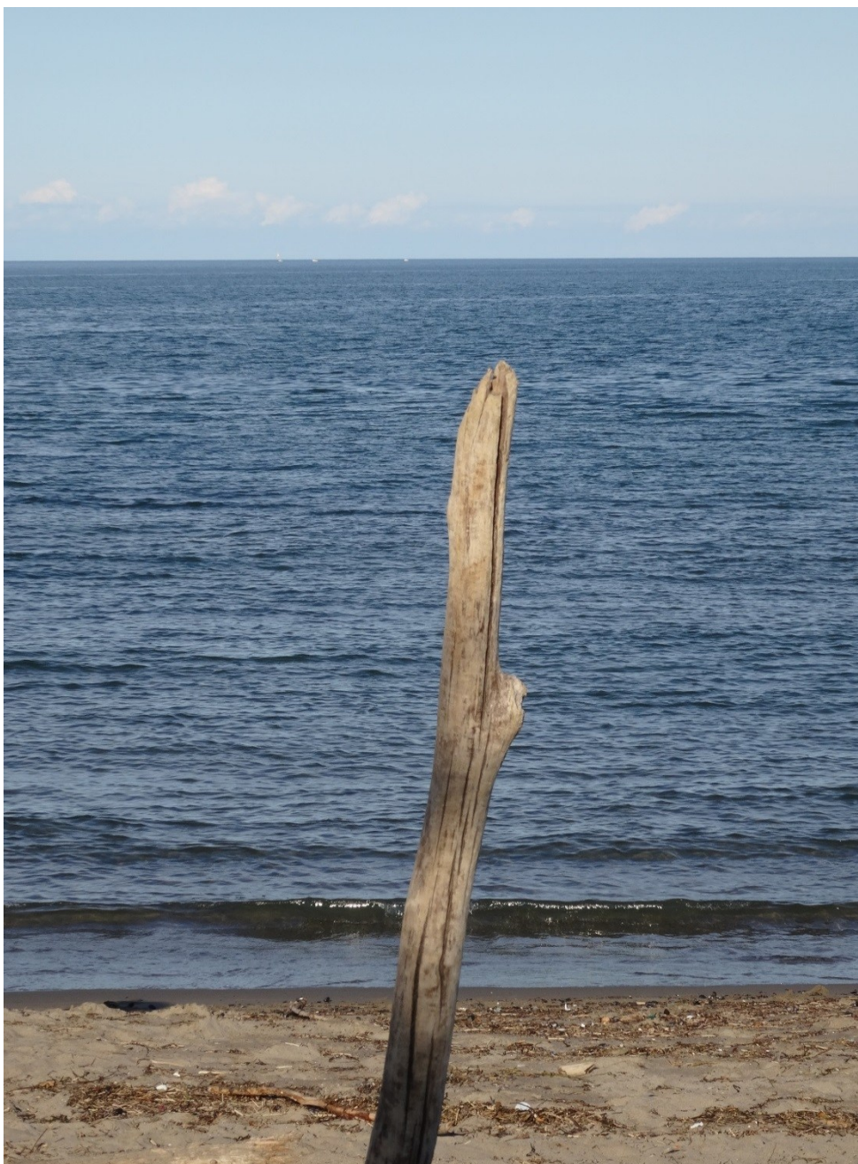
Rosolina Mare, Adria an der Etsch-Mündung, Italien