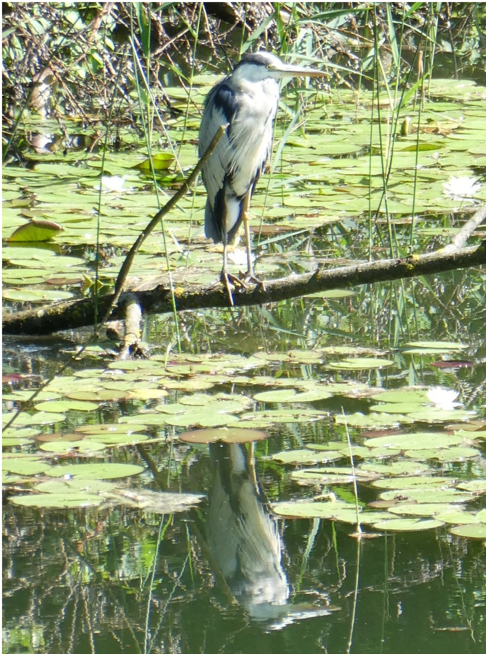
Reiher beim Sauwinkel (Naturgebiet in Altach)