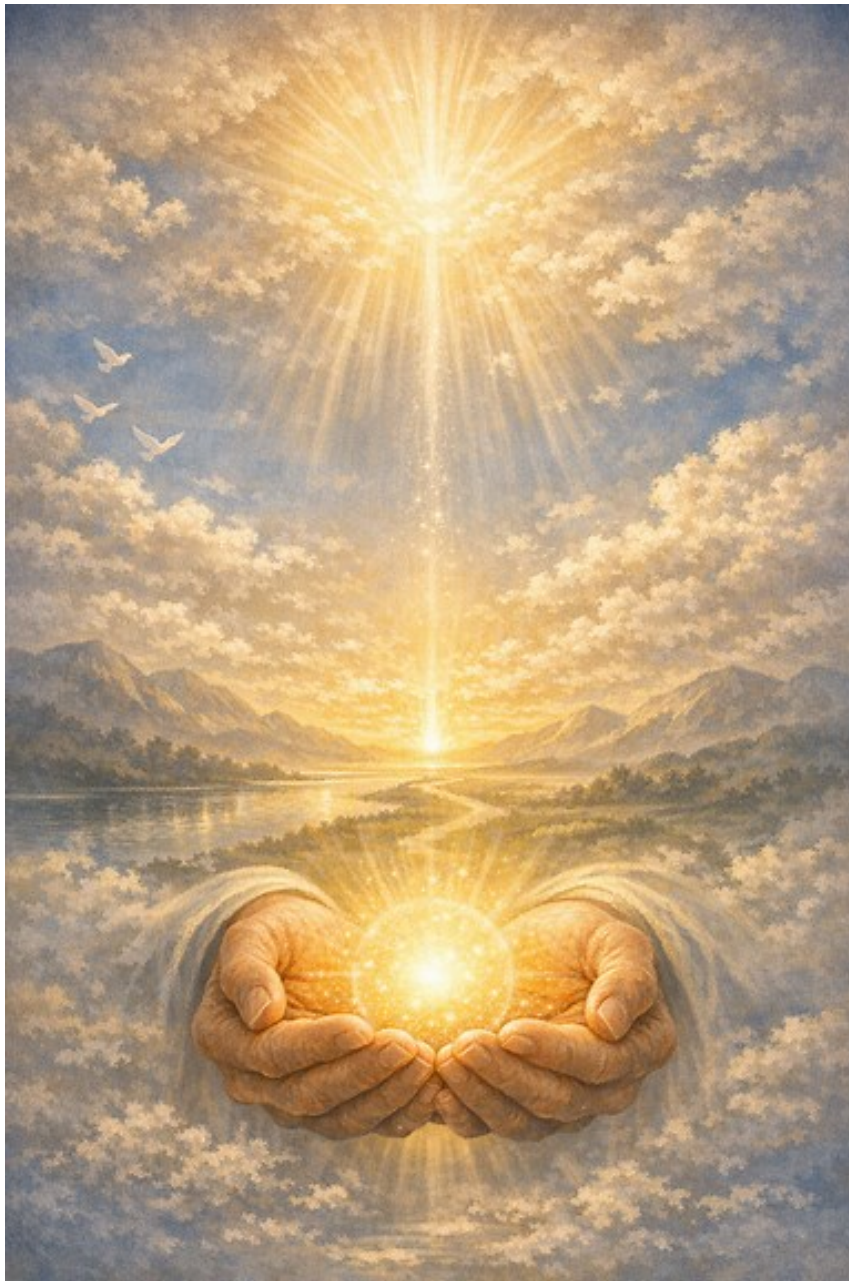
Vorgabe an KI: Zeichne ein Bild zum Text ... (=nebenstehend)