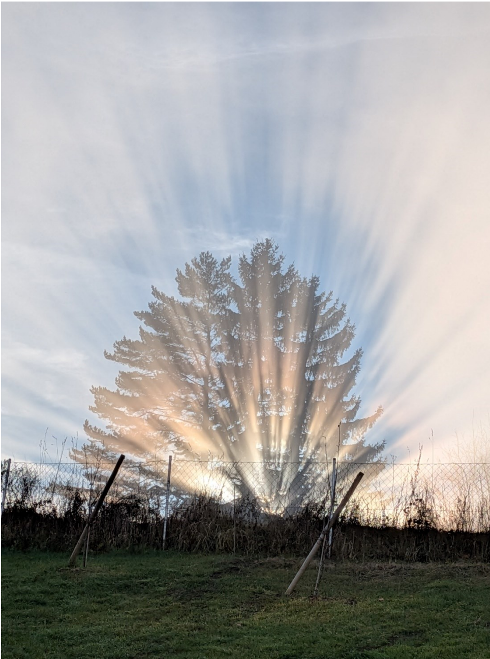
Abendsonne in Baum