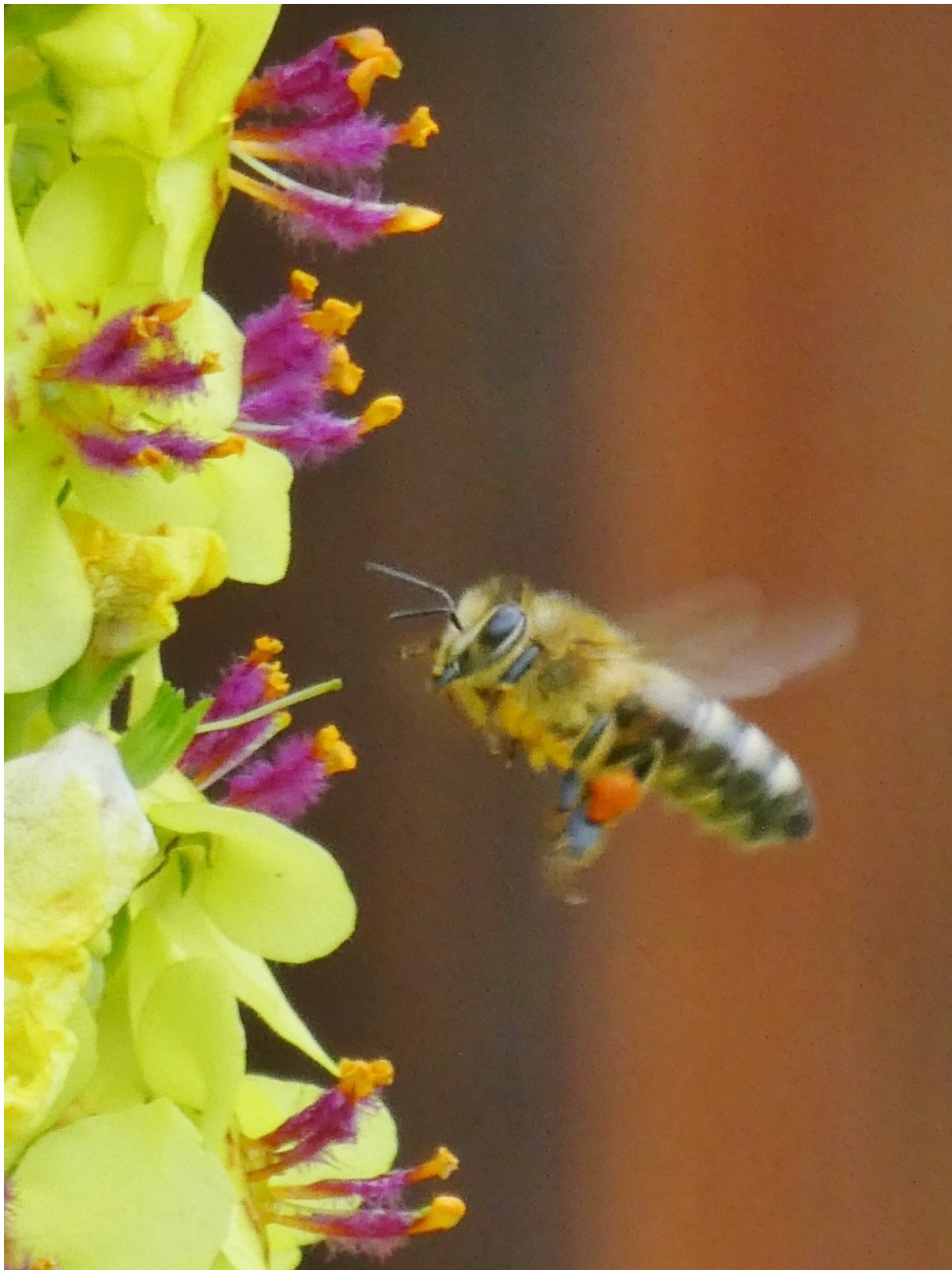
Biene im Anflug zu einer Königskerze, Altach