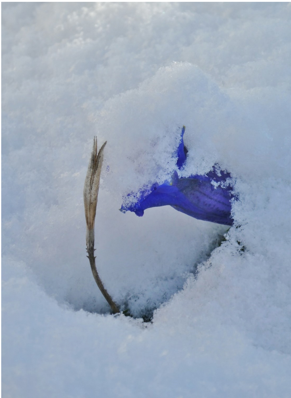
Enzian im Schnee, 11. Dezember 2022