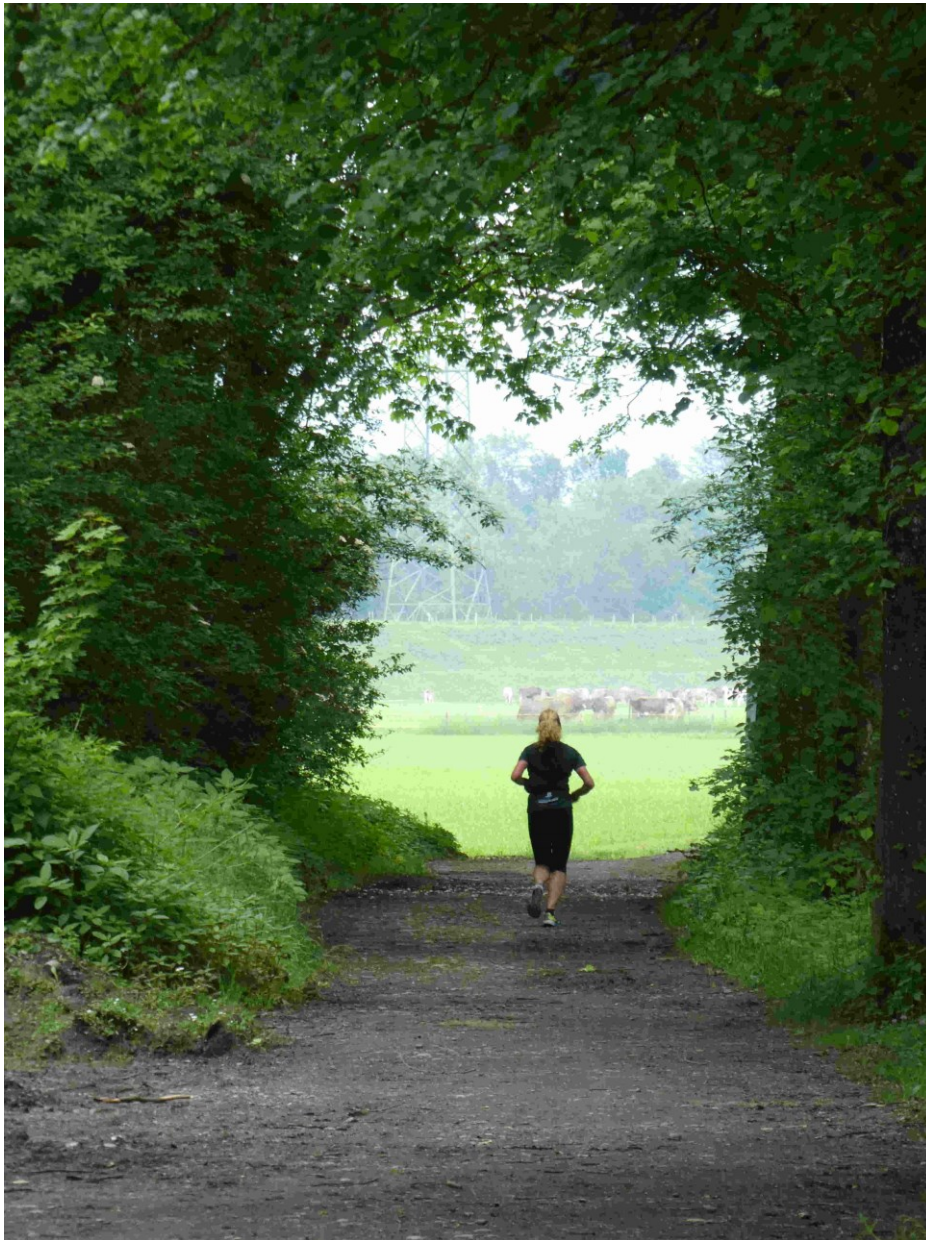
beim Koblacher Kanal, Altach-Mäder, nahe Alter Rhein

Oder hat Nächstenliebe nichts damit zu tun, „wie“ ich dem Mitmenschen begegne?