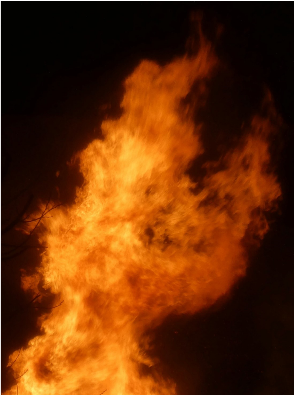
großes Holz-Feuer am Funkensamstag