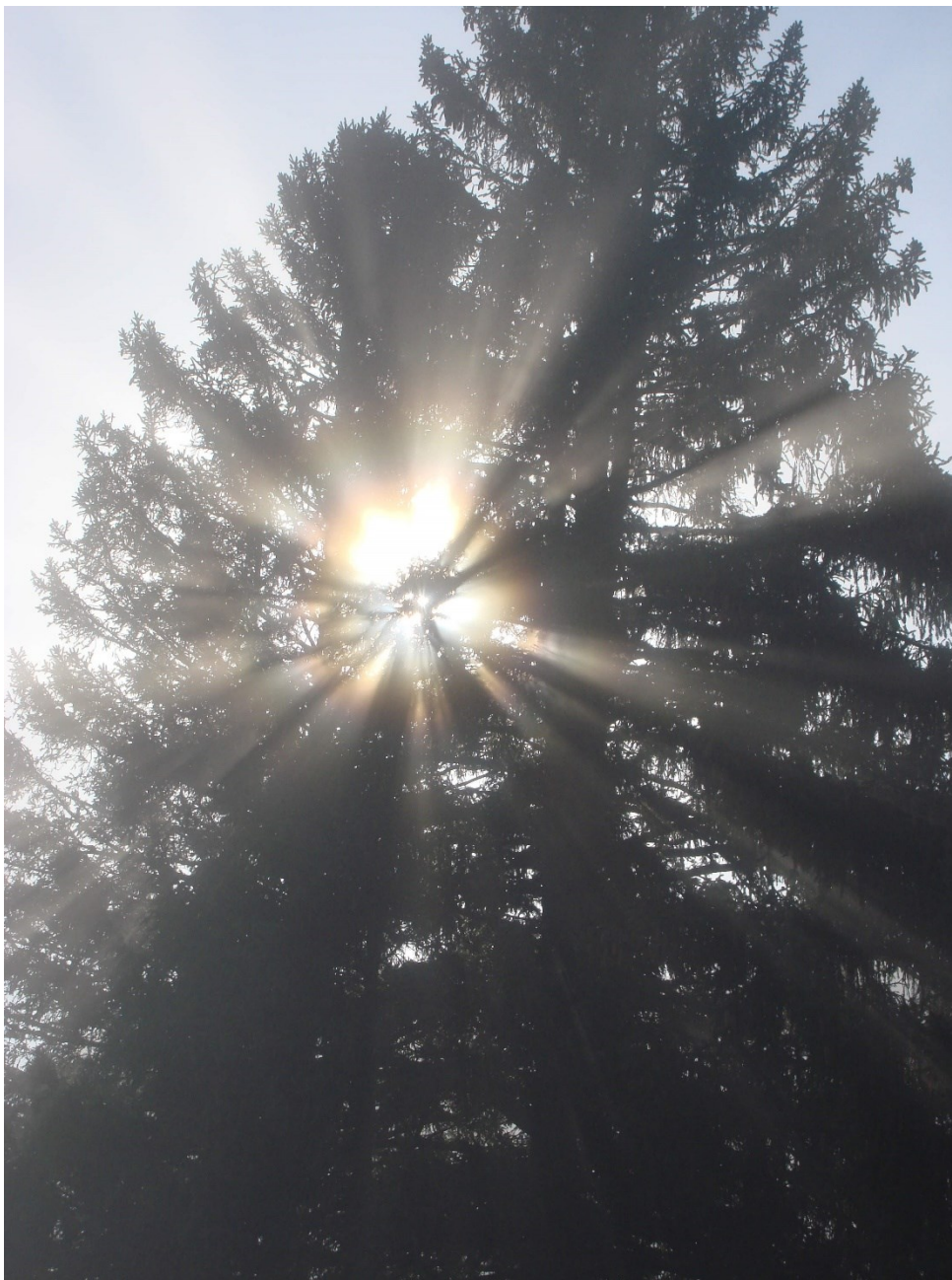
Sonne durch Baum, Brand - Vorarlberg