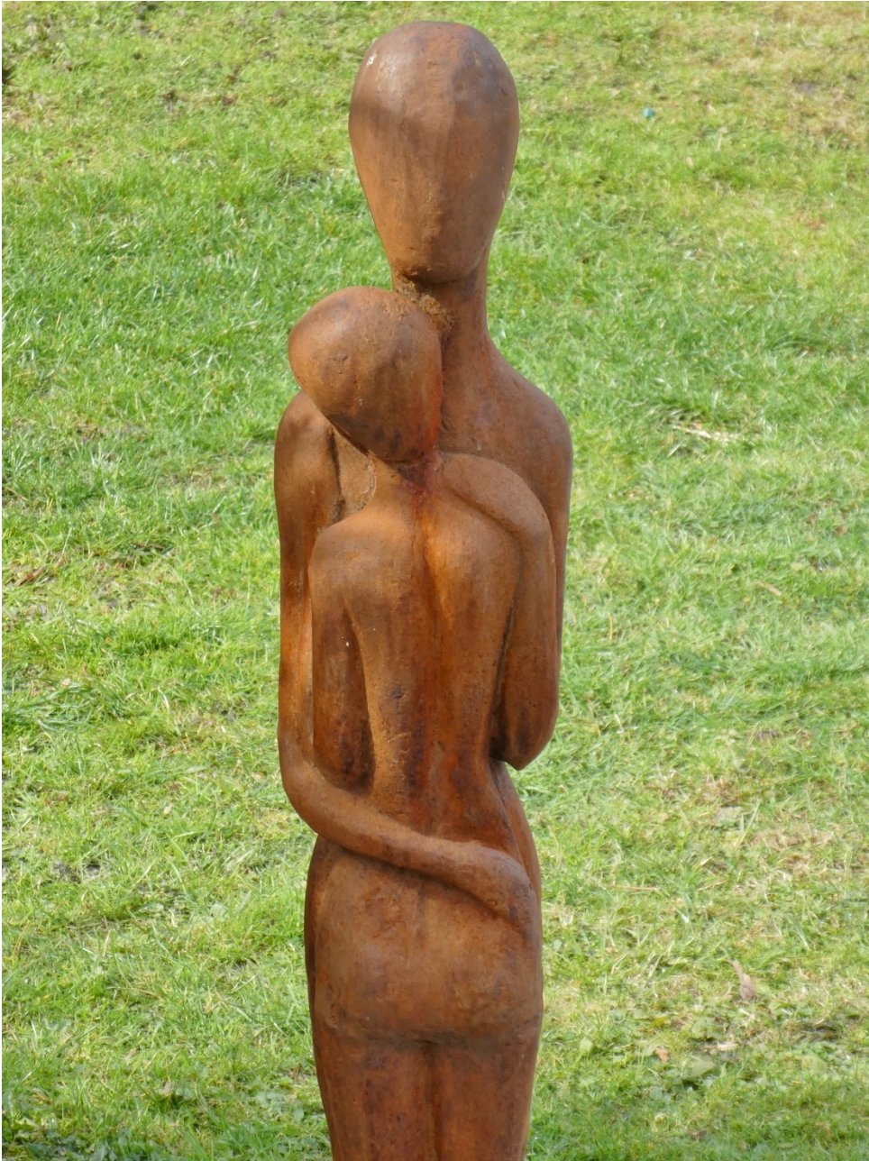
Skulptur in Altach, Walsertal