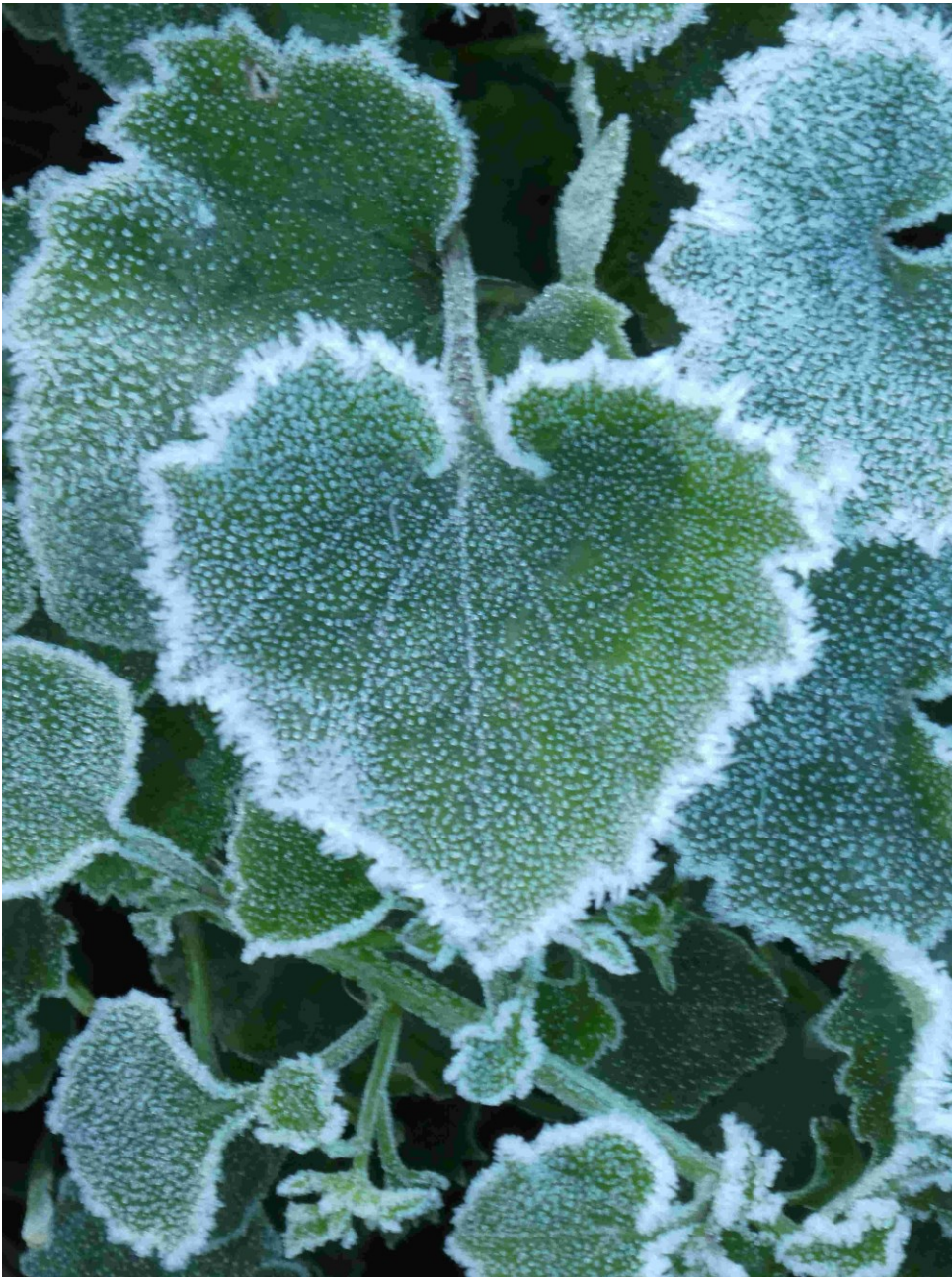
Raureif auf herzförmigem Blatt

bin ich beruhigter und noch stolzer auf ihn.