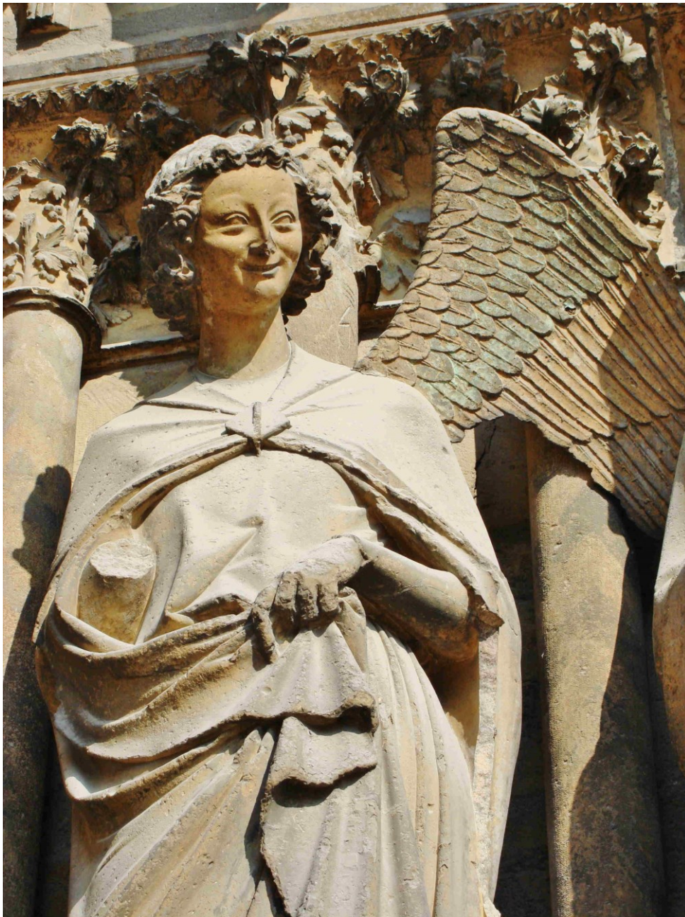
lächelnder Engel, Reims (Frankreich)