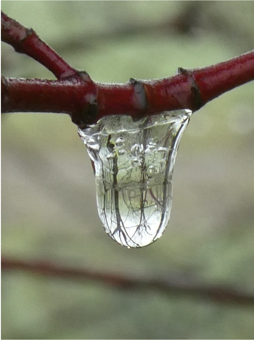
Wassertropfen an Ast neben Koblacher Kanal