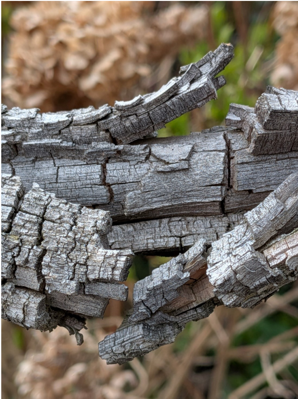
alter, morscher Ast