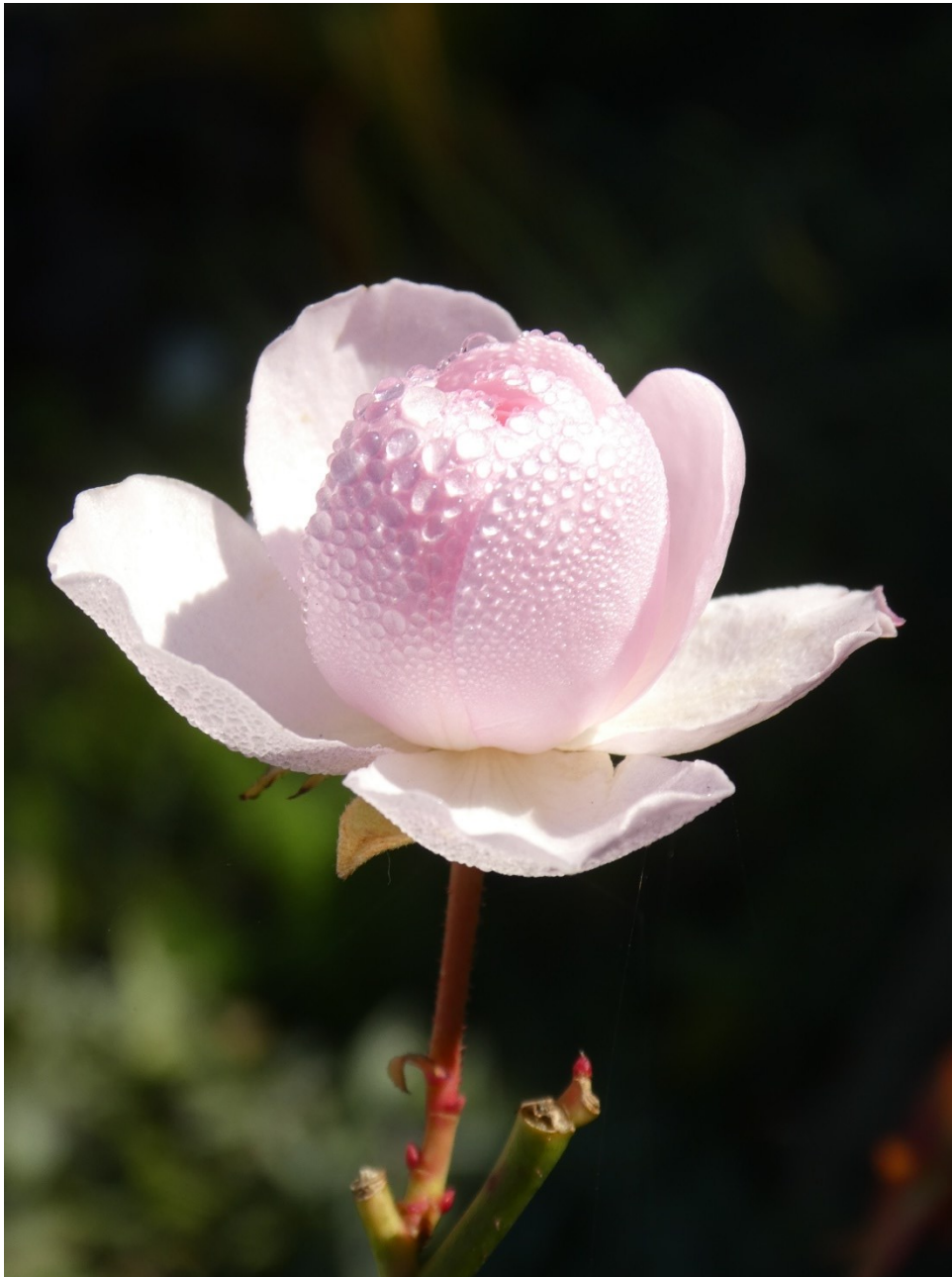
Rose im November