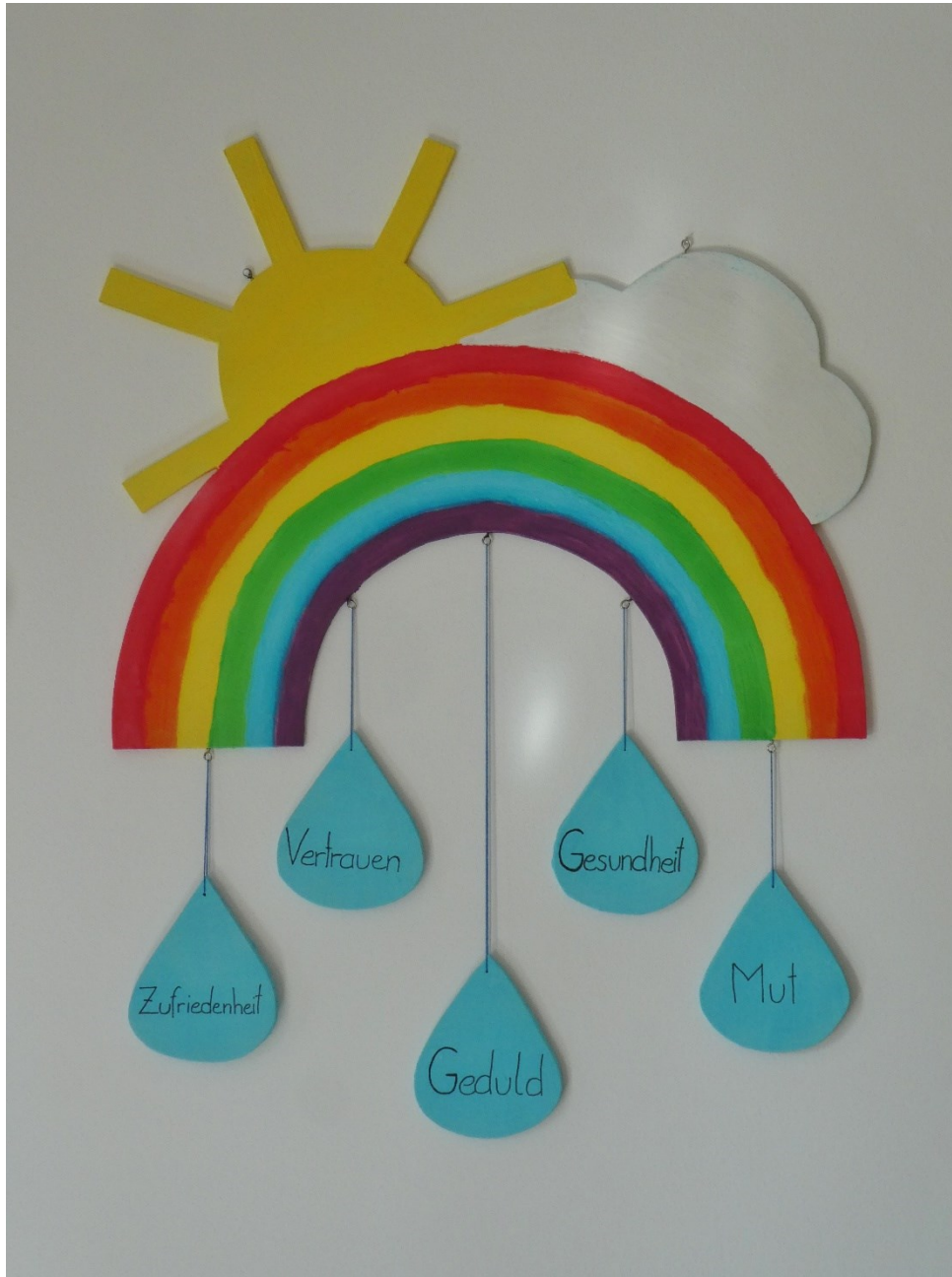
Regenbogen gebastelt zu einer Taufe