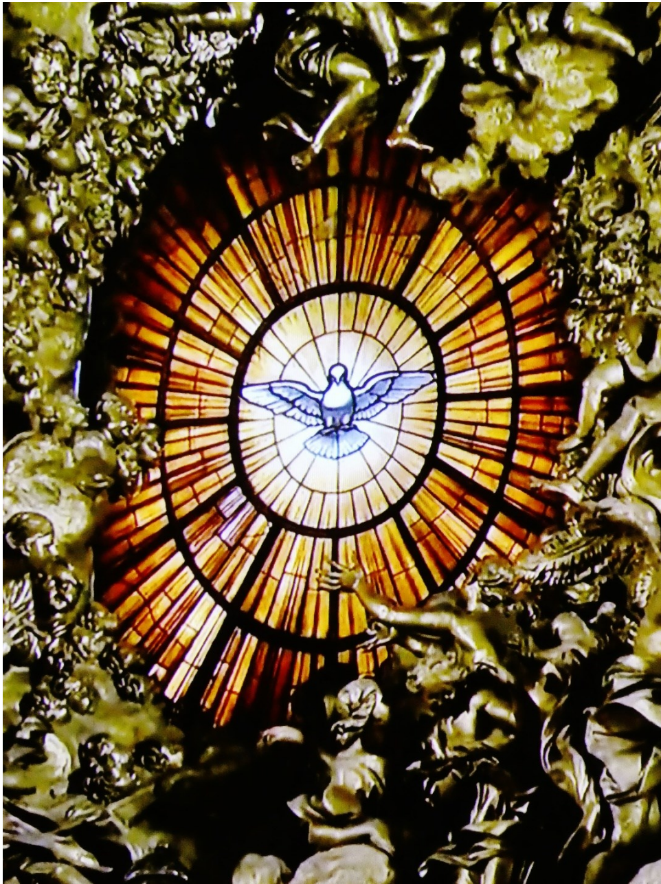
Taube als Symbol des Heiligen Geistes, Petersdom in Rom