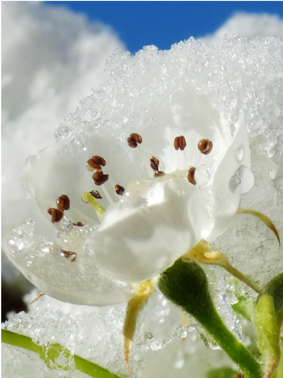
Birnbaumblüte im Schnee