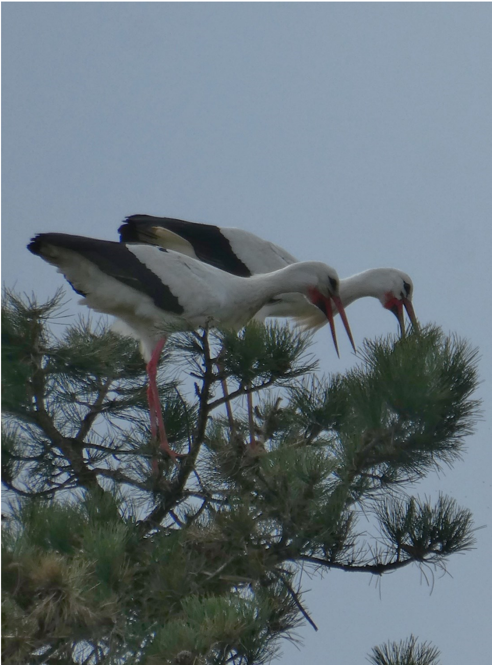
Störche beim Möcklebur