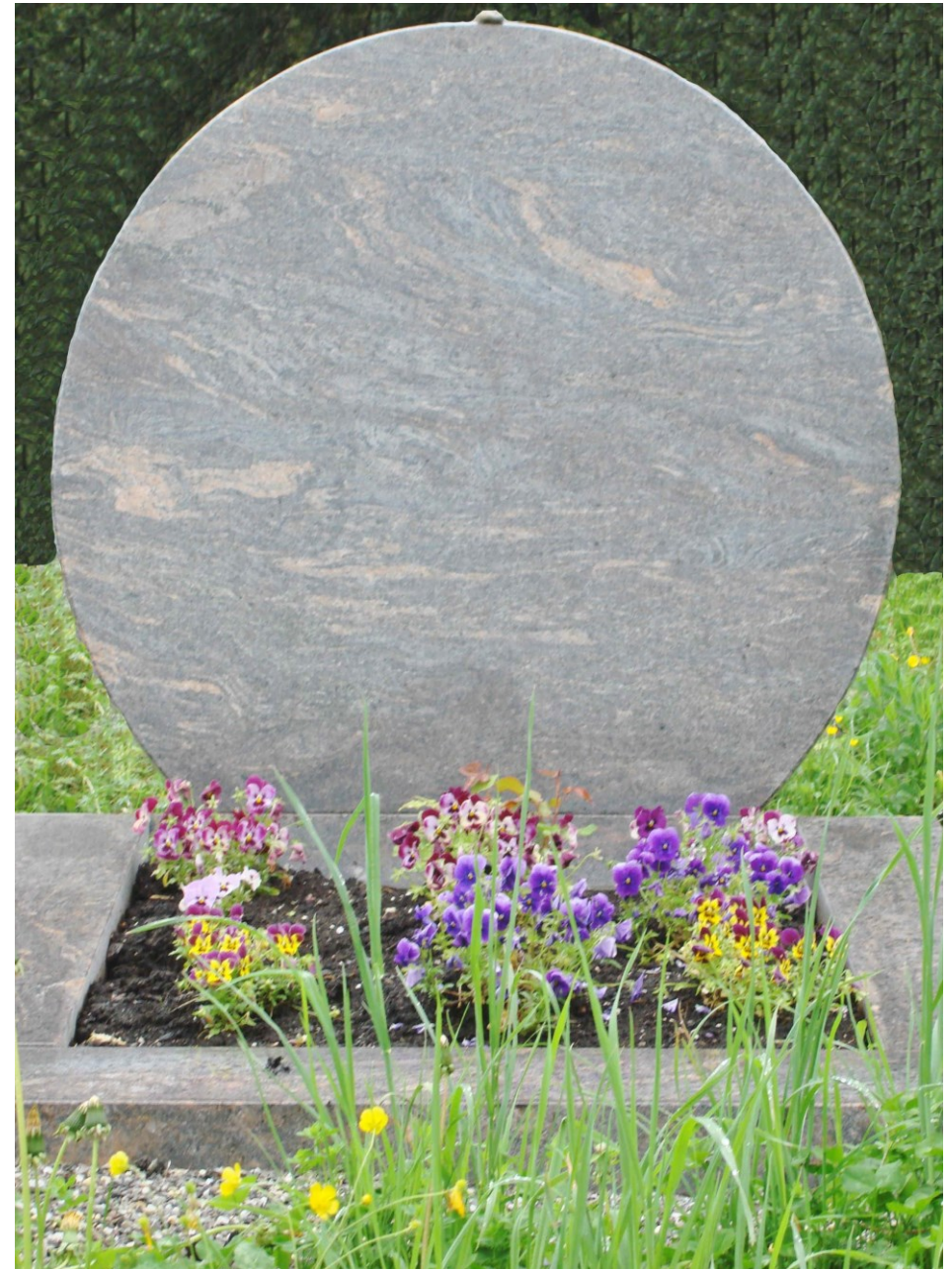
Grabstein im Jüdischen Friedhof in Hohenems