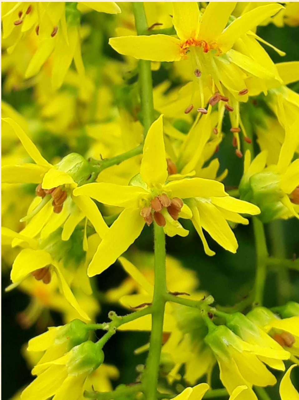
Blüten des Blasenbaums