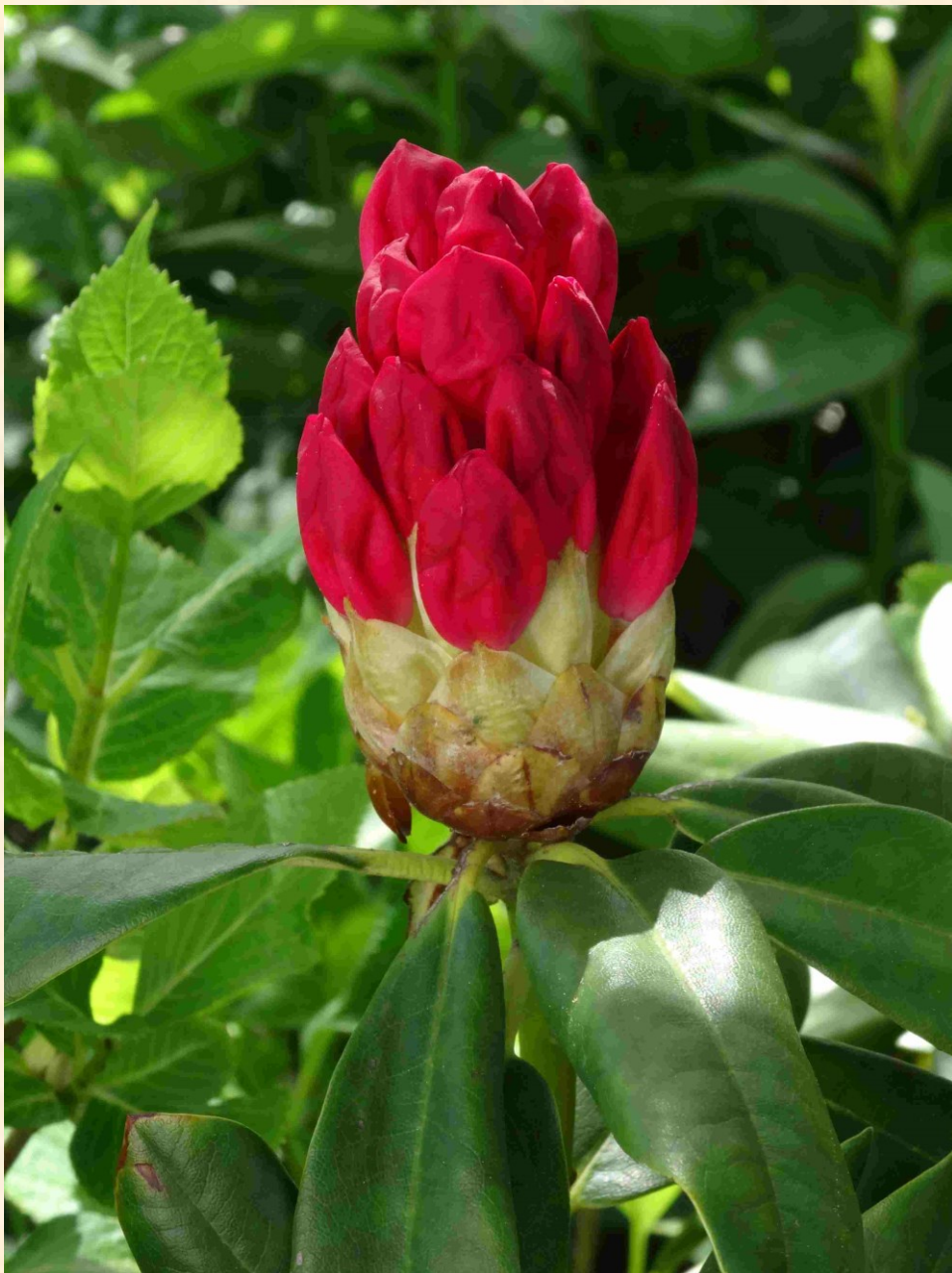
Rhododendron – Blüte im Entstehen