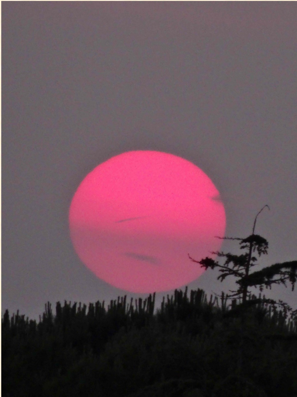
Sonnenuntergang in Jesolo, Italien