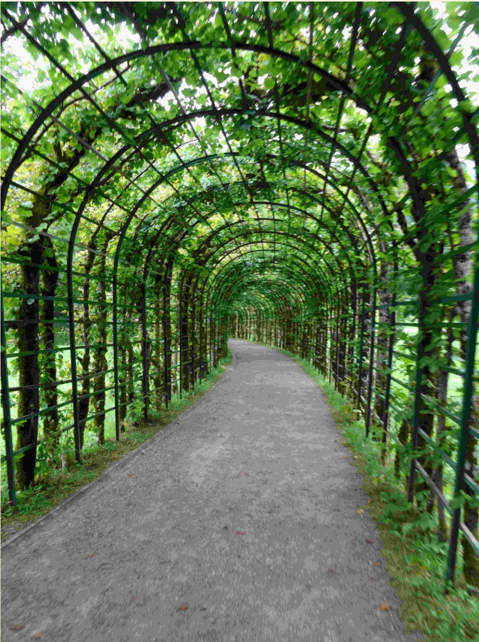
beim Schloss Linderhof, Bayern