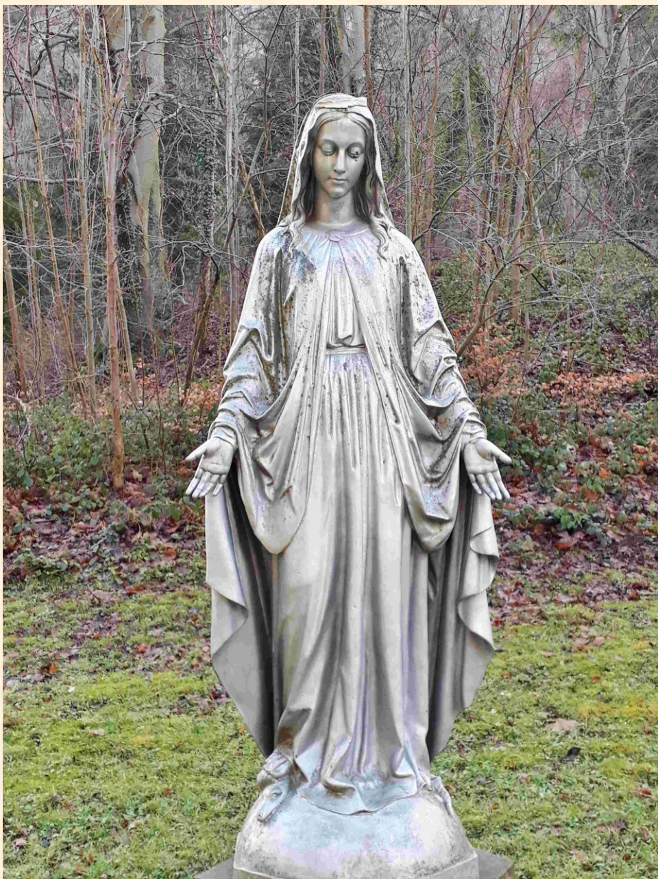
beim Musikkonservatorium / Stella Matutina Feldkirch