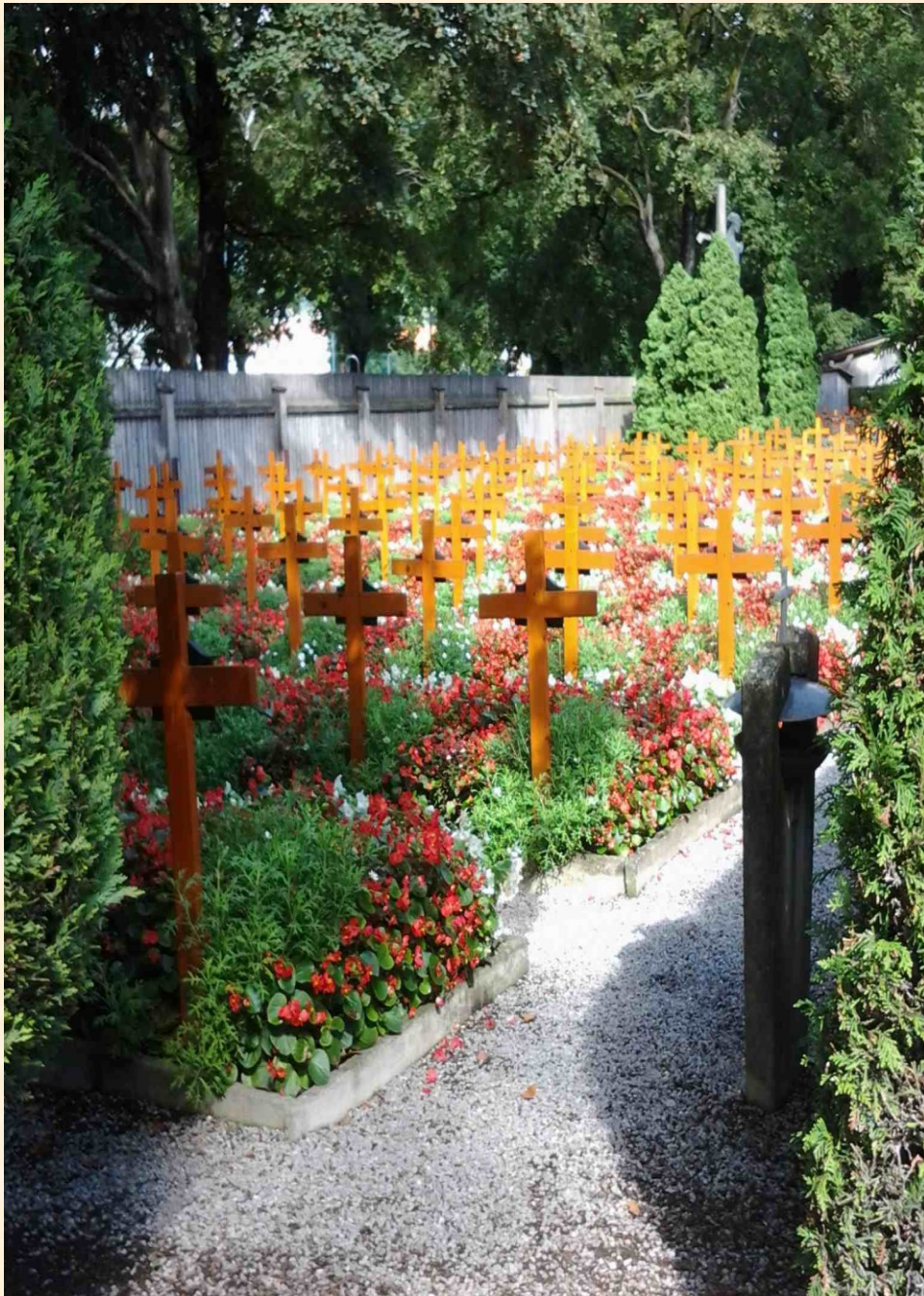
Gräber der Barmherzigen Schwestern, Innsbruck