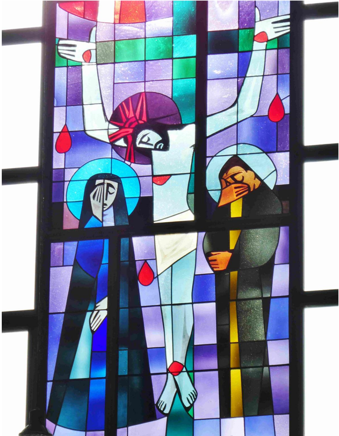
Glasfenster der Kirche in Altsch