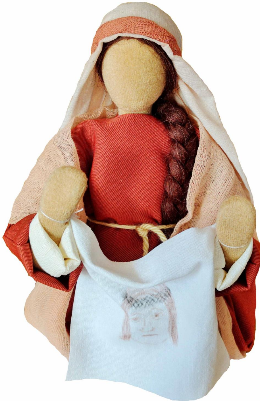
Hl. Veronika, Schwarzenberger Figur