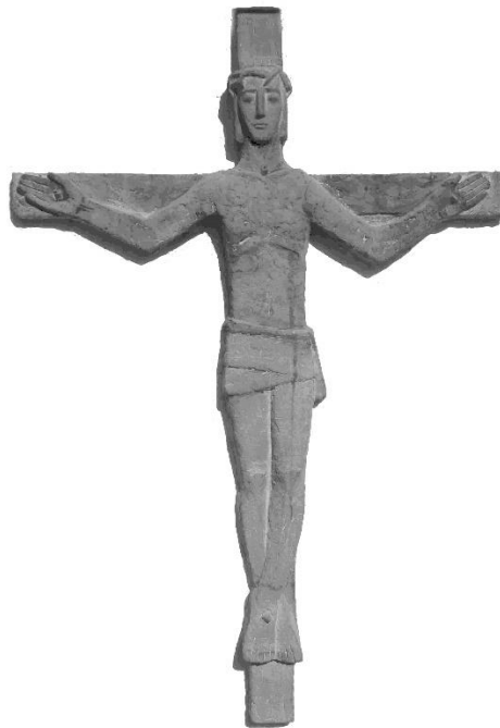
aus dem Kreuzweg der Kirche in Altach

Nach diesen Worten hauchte er seinen Geist aus.