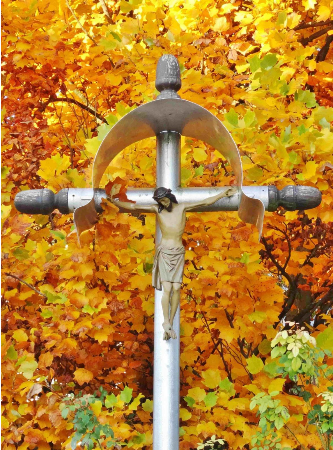
Wegkreuz in Altach, Walsertal, im Herbst