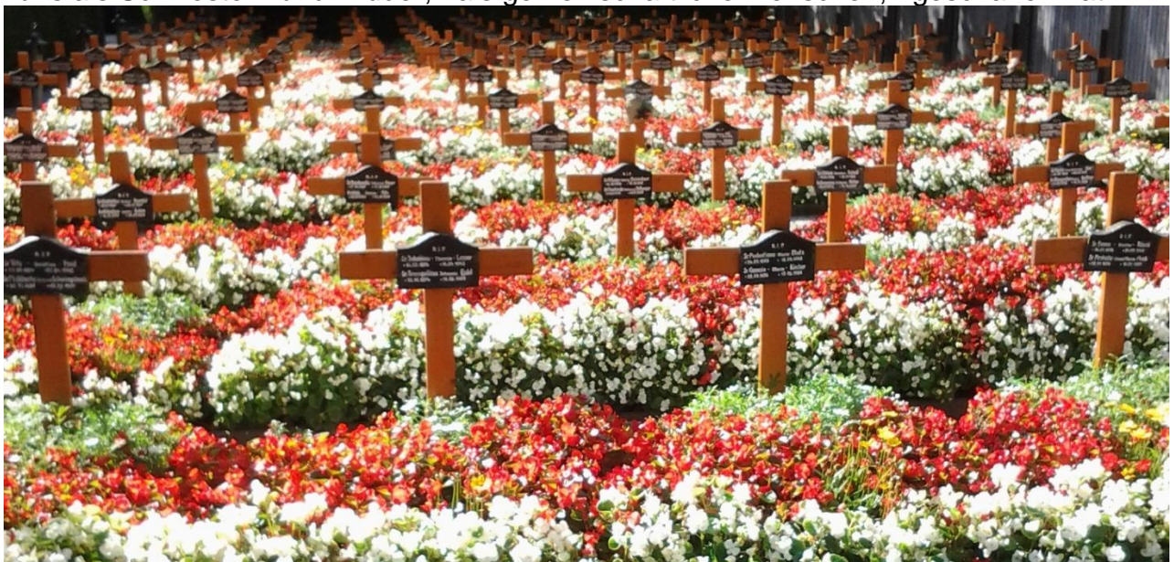
Gräber der barmherzigen Schwestern auf dem Innsbrucker Westfriedhof

der uns als Schwestern und Brüder, als gemeinschaftliche Menschen, geschaffen hat.